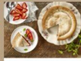
TARTE AUX FRAISES 8" 8 $