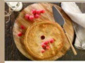
TARTE AUX FRAMBOISES 8" 8 $