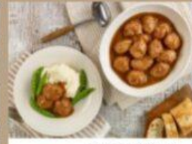
FRAGÔT DE BOULETTES 2-3 portions 800 g 12,95 $