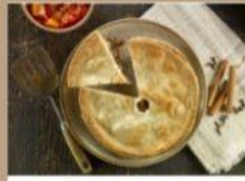
TOURTIÈRE CLOU CANNELLE 8" 9 $