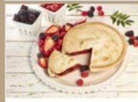
TARTE AUX 5- FRUITS 8" 8 $