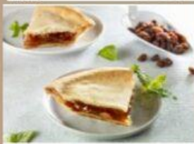
TARTE AUX RAISINS 8" 8 $