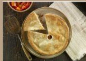
TOURTIÈRE 8" 9 $