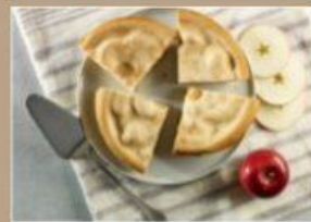
TARTE AUX POMMES 8" 8 $