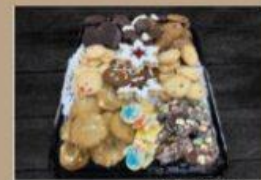
BISCUIT DE NOËL 36 - 26 $ 64 - 42 $