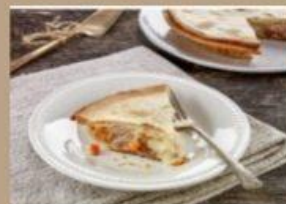
PÂTÉ À LA DINDE 8" 8,95 $